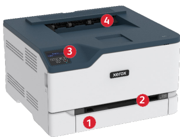
Xerox® C230 Farbdrucker