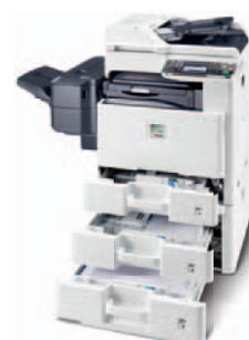
Abbildung mit Optionen.

KYOCERA MITA DEUTSCHLAND GmbH – Otto-Hahn-Str.12 – D-40670 Meerbusch Infoline: 08 00 8 67 78 76 – Fax: +49 (0) 21 59 9 18-106 – www.kyoceramita.de