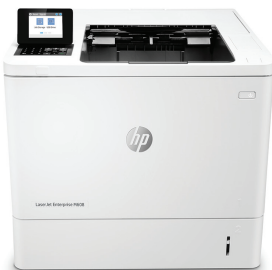
HP LaserJet Enterprise M608dn