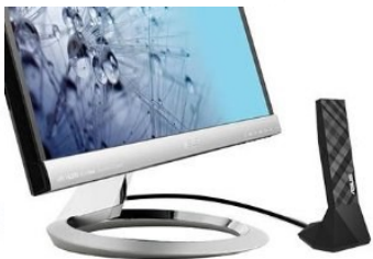
Flexibler externer Standfuß

Im 5 GHz-Band können in der EU die vier Kanäle 36 / 40 / 44 / 48 für Indoor Wi-Fi frei verwendet werden. Mit dem ASUS USB-AC56 WLAN-Adapter können auch die Kanäle oberhalb von 48 empfangen werden. Um Interferenzen zu vermeiden kann mit DFS ein automatischer Kanalwechsel durchgeführt werden. Somit steht das volle Kanalspektrum von 5 GHz zur Verfügung.