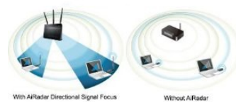
Intelligentes AiRadar Signal-Management

Der ASUS USB-AC56 Adapter bietet die Möglichkeit Daten zur Gegenstelle wahlweise auf dem 2.4 GHz oder auf dem 5 GHz-Band zu übermitteln. Das 2.4 GHz-Band ist sehr gut für das tägliche Surfen im Internet geeignet und bietet in der Regel eine größere Reichweite. Das 5 GHz-Band ist perfekt für ressourcenaufwendige Aufgaben wie das Streaming von Full-HD Multimediainhalten, Übertragungen von großen Datenmengen oder Online-Gaming geeignet.