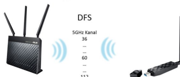
DFS (Dynamic Frequency Selection)

Der USB-AC56 WLAN Adapter verfügt über einen USB 3.0 Anschluss. Der Vorteil liegt darin, dass kein Flaschenhals in der Kommunikation am USB-Port entsteht und die Daten und voller AC-WLAN Geschwindigkeit übertragen werden können.