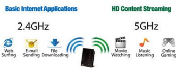
Wählbare 2.4 GHz oder 5 GHz Dual-Band Übertragung

Der externe Standfuß wird über ein mitgeliefertes Kabel (ca. 1M) mit dem ASUS USB-AC56-Adapter verbunden. Durch die rutschfeste Unterseite kann der Standfuß flexibel aufgestellt werden. Dank diesem mobilen Konzept kann der Adapter auf die beste Empfangsqualität hin ausgerichtet werden.