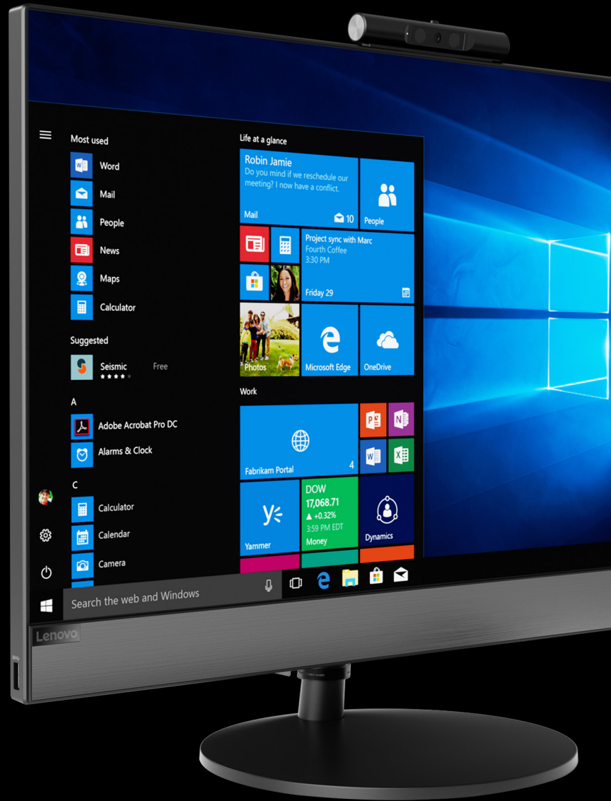
Lenovo V530 AIO DESKTOP