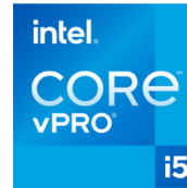
Intel® Core™ i5 vPro™ Prozessor