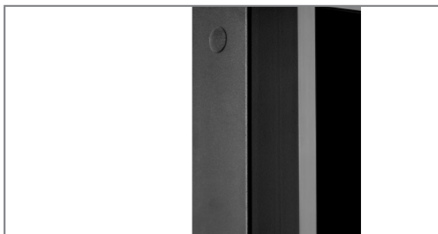
schlag- und kratzfeste Pulverbeschichtung