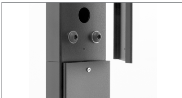
Kabelführung innerhalb des Rahmens und der Tragsäulen