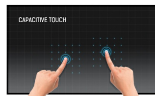
Touch technologie - Kapazitiv

Die IPS Panel Technologie bietet einen hohen Kontrast und gute Farbbrillanz, bei einem viel größeren Einblickwinkel als bei der standard TN-Panel Technologie.