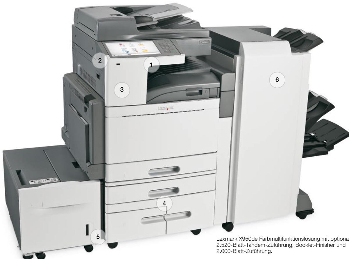
Lexmark X950de Farbmultifunktionslösung mit optionaler 2.520-Blatt-Tandem-Zuführung, Booklet-Finisher und 2.000-Blatt-Zuführung.