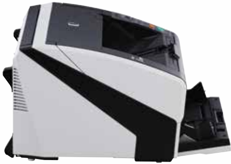
fi-7800 – A4 Querformat mit 300 dpi 110 ppm / 220 ipm fi-7900 – A4 Querformat mit 300 dpi 140 ppm / 280 ipm Scannen von gemischten Stapeln über die Zufuhr mit 500 Blatt Fassungsvermögen