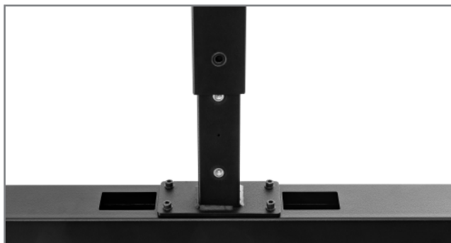
Höhenverstellung über montageseitig einstellbare Raststufen

Die Oberfläche ist schwarz und mit einer schlag- und kratzfesten Pulverbeschichtung veredelt.