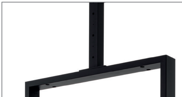
Kabelführung innerhalb des Rahmens