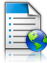
Formulare und Favoriten

Die Lösungen dieser Serie, die Lexmark Tools zur Flottenverwaltung und Ihre bestehende Enterprise-Software und technische Infrastruktur kombinieren, bilden gemeinsam das Lexmark Smart MFP-Ecosystem. Die damit verbundene Anpassbarkeit sorgt dafür, dass Ihre Investition in die Lexmark Technologie eine zukunftssichere Anlage ist.