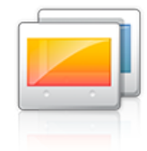
Anpassung des Displays