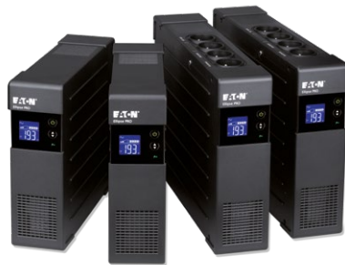
Ellipse PRO Baureihe