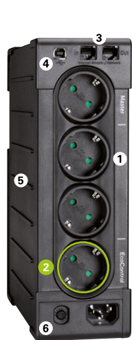
Eaton Ellipse PRO 650