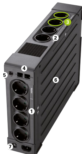
Eaton Ellipse PRO 1600