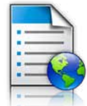
Formulare und Favoriten