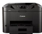
MAXIFY MB2750 Modelle